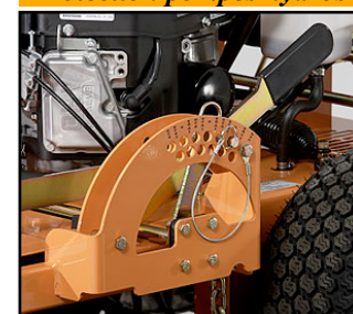
Règlage hauteur de coupe

A T C Vert Tech Sarl - 5 Rue Bartholdi - 67150 Gerstheim Claude Thomann Portable: 0 673 108 559 - Mail: thomann@evc.net