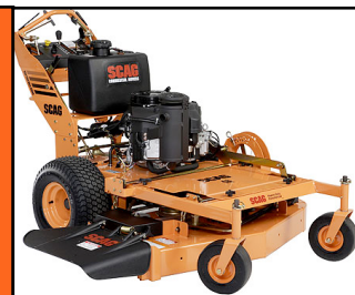
Scag SWZT Hydro