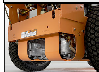
Protection pompes hydros